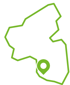
Lage in RLP