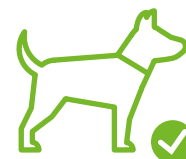
Hund kann mitgebracht werden