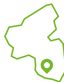
Lage in RLP