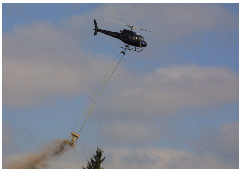
Abb. A2: Helikopter des Typs Accureil AS 350 bei der Bodenschutzkalkung Fig. A2: Helikopter Type Accureil AS 350 during liming