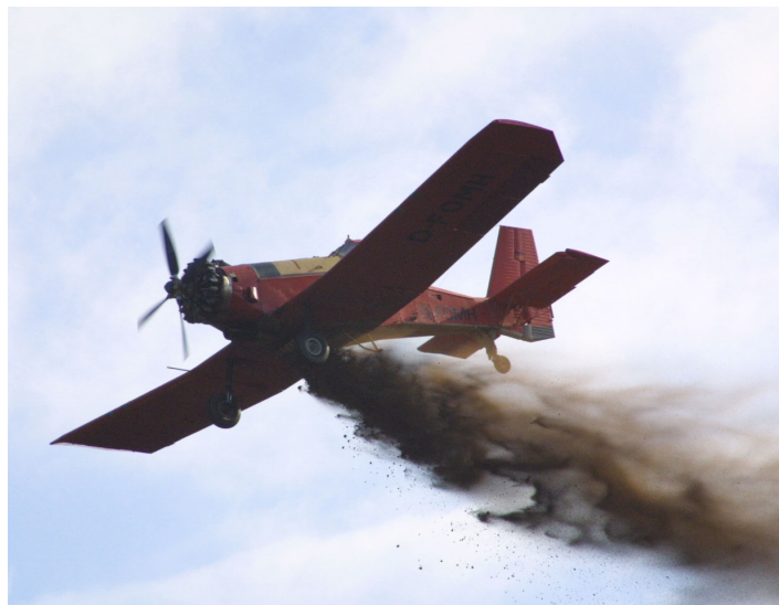
Abb. A1: Luftfahrzeug des Typs M 18 A Dromedar bei der Bodenschutzkalkung Fig. A1: Airplane type M 18 Adromedar during liming

GIS dokumentiert und durch Verteilkontrollen auf dem Boden überprüft. Um einen unmittelbaren Vergleich zwischen den beiden Luftfahrzeugtypen vornehmen zu können, wurden dieselben Teilflächen sowohl vom Helikopter als auch vom Starrflügler mit 3 to/ha Dolomit gekalkt. In der zu kalkenden Waldfläche lag ein Naturschutzgebiet als Ausschlussfläche.